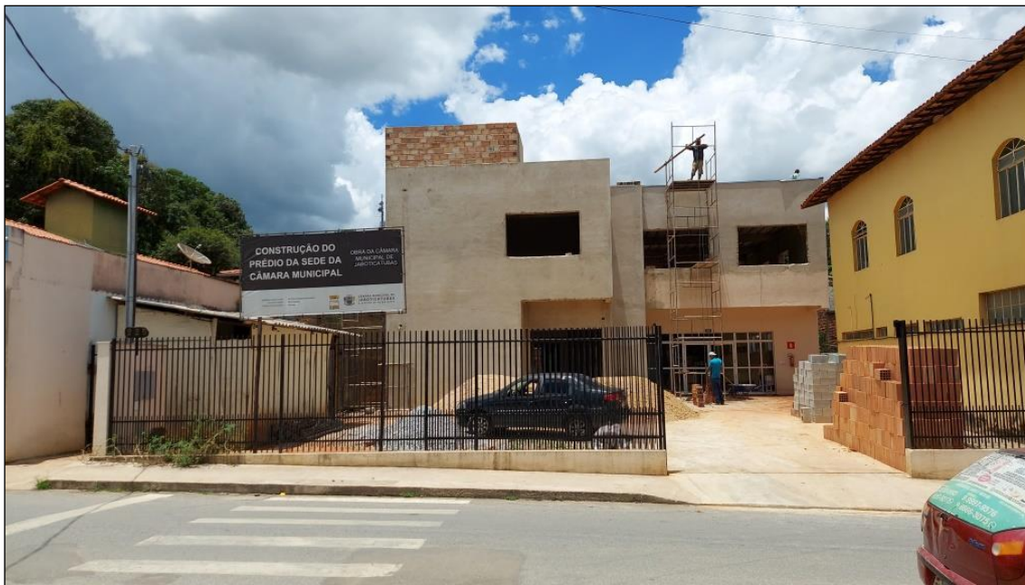
Figura 2: Situação da construção do prédio da Câmara - frente