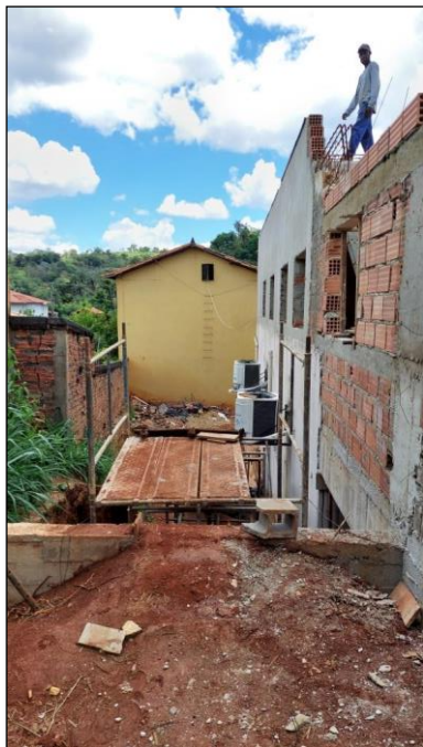
Figura 9: Local de plantio de grama e arbustos nas laterais do terreno