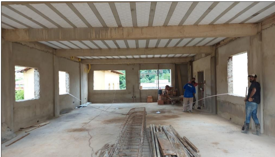
Figura 4: Local de implantação das paredes drywall