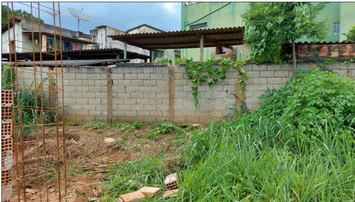
Figura 8: Áreas de implantação de passeios e plantio de grama nas laterais do terreno